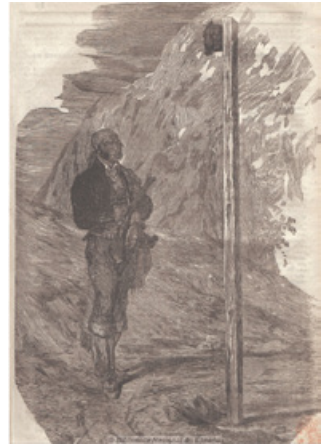
Imatge 12. Gravet en fusta "Un bandoler contemplat el cap d'un altre dels seus companys, col·locat en un camí" ( Semanario Pintoresco Español , 22 de desembre de 1839, Castella), que és una reproducció del quadre de Rafael Tejeo Díaz

La quarta, la de més al sud, la més meridional, abraça fins i tot part del territori murcià (veg. imatge 16). Inclou les comarques del Vinalopó Mitjà, el Baix Vinalopó i el Baix