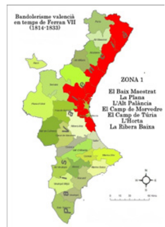
Imatge 13. Primera edat daurada del bandolerisme valencià del segle XIX (Zona 1)