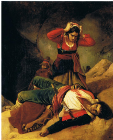
Imatge 1. Reproducció estàndard de la pintura titulada The Death of the Brigand [La mort del bandit], obra de Louis-Léopold Robert (oli sobre llenç, Roma), probablement exposada al Saló de París de 1824. Museu The Wallace Collection (Hertford House, Manchester Square, Londres, Gran Bretanya)

Ací teniu, en pantalla, una imatge (veg. imatge 1). És un oli. Un dels tants olis que es van pintar al segle XIX i que retrataven el fenomen del bandolerisme a l'arc mediterrani. El nostre territori –i, per extensió, la zona de la Mediterrània– és, sens dubte, on més s'ha manifestat aquest fenomen. Tenim constància que el bandolerisme s'ha manifestat, al País Valencià, d'una manera intensa des de temps