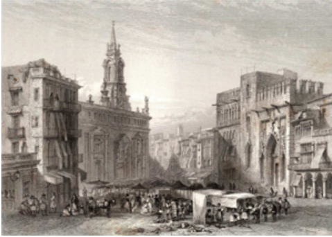
Imatge 4. La plaça del Mercat de València (Voyage pittoresque en Espagne et en Portugal, Émile Béglin, Germans Adolphe i Émile Rouargue, 1852)

instal·lat de manera permanent el Consell de Guerra.