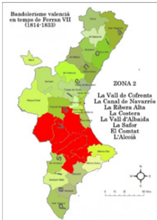
Imatge 14. Primera edat daurada del bandolerisme valencià del segle XIX (Zona 2)