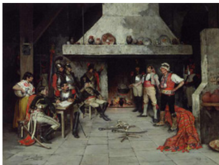
Imatge 3. L'interrogatori (Domingo Muñoz Cuesta, 1885)

És el que veiem en aquesta il·lustració (veg. imatge 3). Aquest oli és de final del segle XIX i està retratant aqueix procés de repressió. La monarca necessita l'exèrcit perquè comence a funcionar el consell de guerra com a òrgan competent en totes les causes formades per bandolerisme. Es constitueixen consells de guerra en capitals, sobretot en capitals de regne. Al País Valencià, per exemple, resta