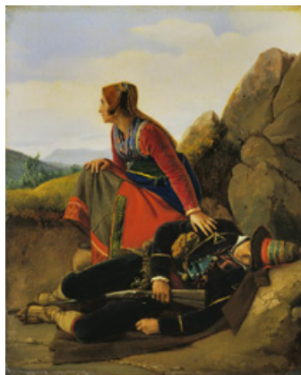
Imatge 5. Dona de bandoler vigila mentre dorm el seu marit (Louis-Léopold Robert, 1824)

Tenim una imatge (veg. imatge 6) que apareix publicada a primeries del segle XX en una revista barcelonina, on queda reflectit el segon dels vincles, el vincle territorial. El roder és un rebel que viu fora de la llei i fa vida fora dels nuclis de població (generalment, en despoblat), espai