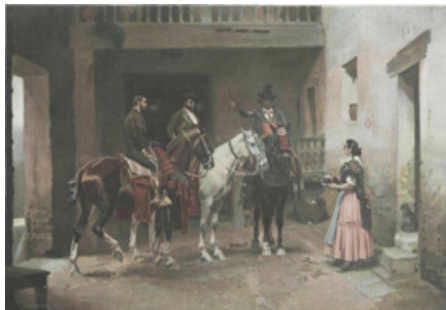
Imatge 6. Al parador (Àlbum Salón, 1 de gener de 1902, Marcelino de Unceta y López)