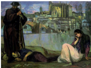
Imatge 18. El orden (Gustavo de Maeztu y Whitney, 1918-1919)