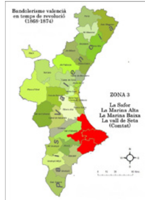
Imatge 21. Segona edat daurada del bandolerisme valencià del segle XIX (Zona 3)

la Marina Baixa i la vall de Seta, que és una subcomarca del Comtat. Aquest és l'escenari geogràfic del treball El robatori de Benimassot .