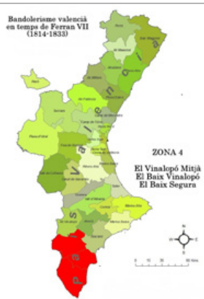
Imatge 16. Primera edat daurada del bandolerisme valencià del segle XIX (Zona 4)

Segura. Ací va campar al seu gust, va plantar bandera, el crevillentí Jaume Alfonso Juan, més conegut com Jaume de la Serra o Jaume el Barbut , sens dubte el roder valencià més estudiat del Vuit-cents.