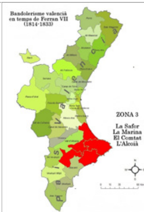
Imatge 15. Primera edat daurada del bandolerisme valencià del segle XIX (Zona 3)