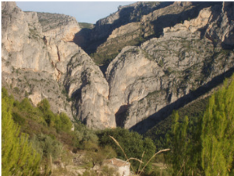
Imatge 2.: Vista general del Cossi i el pas dels Bandolers, presa des del barranc de Sacos, en terme de Callosa d'en Sarrià