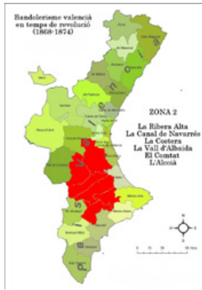
Imatge 20. Segona edat daurada del bandolerisme valencià del segle XIX (Zona 2)