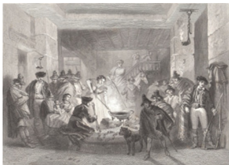
Imatge 7. Una venta (Voyage pittoresque en Espagne et en Portugal, Émile Bégin, Germans Adolphe i Émile Rouargue, 1852)